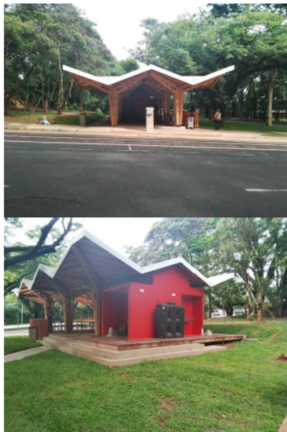
Imagem 2 - Centro de Vivência Paineira

1.2 Além dos TPUSP emitidos, será divulgada uma lista de cadastro de reserva para até 4 (quatro) TPUSP , para o caso de novas vagas ou substituição de permissões revogadas no período de validade do edital.