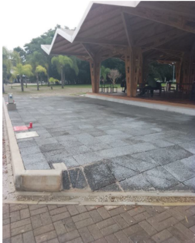
Imagem 1 - Centro de Vivência Araucárias

1.1.2 O Centro de Vivência Paineira ( CV-PA ) situa-se entre os edifícios da História e Geografia (Faculdade de Filosofia, Letras e Ciências Humanas) e edifícios do Instituto de Química (IQ) e Faculdade de Ciências Farmacêuticas (FCF), na esquina entre a Avenida Prof. Lineu Prestes e a Travessa 12. O Centro de Vivência FFLCH-IQ-FCF é composto pela referida área principal (161,24 m 2 ) e por duas áreas de convívio complementares (11,52 m 2 ).